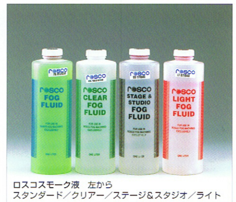
ロスコスモーク液 左から スタンダード/クリアー/ステージ&スタジオ/ライト

ロスコスモークマシンから大気中に放出される煙は煙感知器に反応します。不特定多数の人が出入りする建物内で使用する場合は、必ず事前に建物内の防災センターに連絡するようにしてください。